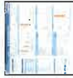
Report Sintesi AL e Anomalie

Owner: Elaborato da AL Visibilità: Responsabile AL/RUR Frequenza: Mensile